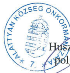
Huszár Arnold polgármester