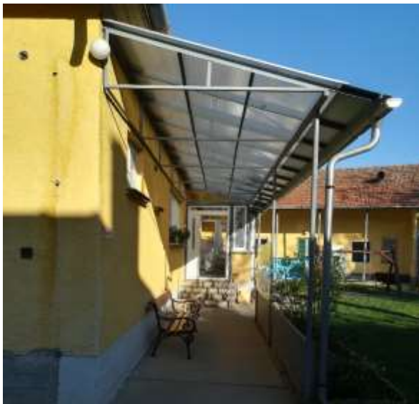
Mozgáskorlátozottak részére is alkalmas bejárat kialakítása...