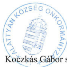
Koczkás Gábor sk. polgármester